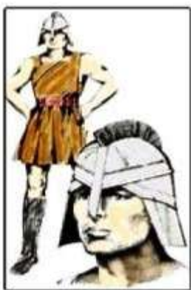
Válečný démon - vypadali jako nějací pěkní atleti

Když mi byli démoni ukazováni jeden po druhém, velmi brzy jsem zjistil jejich sociální strukturu a hodnosti, které mezi nimi existují. Ti, kteří byli ve vysoké hodnosti, mi byli ukázáni ve formě podobné lidem. Když jsme procházeli těmito hodnostmi dolů, viděl jsme démony, kteří vypadali napůl jako člověk a napůl zvíře. Pak jsem viděl démony, kteří vypadali jako zvířata, která máme v tomto světě a nakonec jsem viděl démony tak odporně vypadající, že není možné si něco tak odporného ani představit.