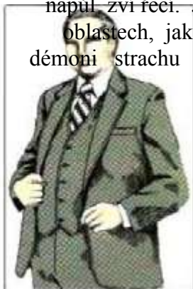
Démon chamtivosti vypadal jako řádný občan, oblečený do „byznys“ saka.

Na třetí pozici mezi těmito nejmocnějšími démony mi byli ukázáni démoni v různých pomíchaných podobách a tvarech. Někteří měli lidskou podobu, zatímco jiní napůl lidskou a napůl zvířecí. Jiní vypadali úplně jako zvířata. Tito démoni byli cvičeni v temných oblastech, jako je čarodějnictví a jiné podobné oblasti. V této skupině byli také démoni strachu a démoni sebezničení, stejně tak jako duchové, kteří napodobují duchy zemřelých a projevují se ve fyzickém světě jako zjevení.