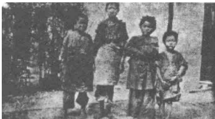
Někteří další „opovrhovaní“

Cožpak v tom, co Pán udělal a zjevil těmto odhozeným a zavrženým žebráckým chlapcům a děvčatům není důkaz Slova Božího? „Nemnozí moudří podle těla, nemnozí mocní“ následují tu úzkou cestu jednoduché víry v Boha. On si stále může a také si vybírá tyto opovrhované a jednoduché čínské děti ulice a příkopů, aby „zahanbil ty věci“, které jsou tak učené a moudré v tomto věku bezbožného myšlení a světské moudrosti.