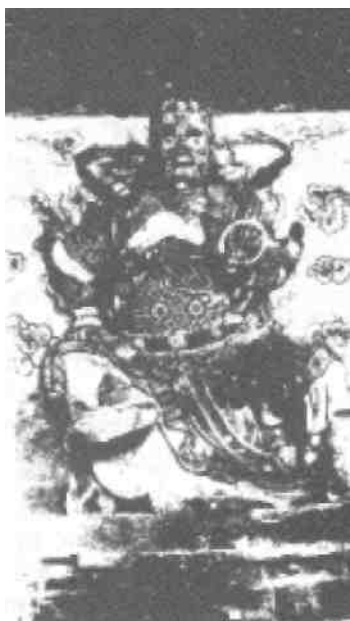
Modla podle podoby démona. Někteří démoni takto podobně vypadají a někteří ještě hůř.

jistě, jak andělé slouží a svatý Duch vede do opravdového království světla, tak jistě démoni zadržují a ďábel je vede v oblasti zlých duchů v království skutečné temnoty. Jak jedno tak i druhé království nám bylo ukázáno. Člověk nám byl ukázán jako bitevní pole. Bible nás vyučuje, že jsou nižší a vyšší hodnosti mezi zlými duchy. (Římanům 8:38 Weymouth ) a že naše bojování není „ proti krvi a tělu, ale proti vládám, proti autoritám, proti světovládcům této temnoty, proti duchovním mocnostem zla v nebeských oblastech. “ Efezským 6:12 KMS. Jak Starý, tak i Nový zákon vyučuje realitě království temna a realitě démonů.