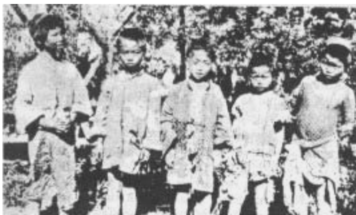
NOVÁČCI: Jako títo chlapci vypadala většina těch, kteří přišli do záchranného domova Adullam.