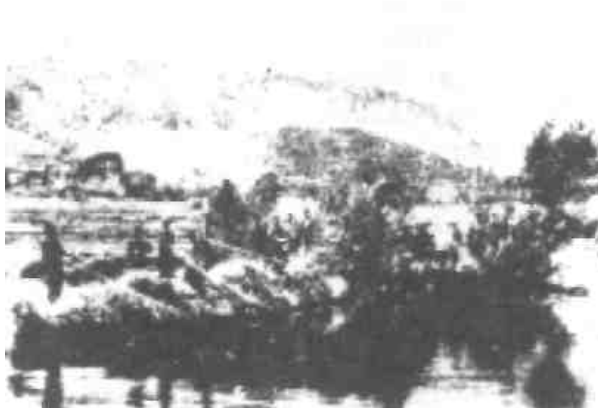
Adullamští chlapci odpočívají u tichých vod. Věří, že když jednoho dne opustí tyto krásné přírodní scény, čeká je mnohem nádhernější příroda v Edenu Nového Jeruzaléma, který je v nebi.

O nebeské krajině je nám řečeno: „ Potom mi ukázal čistou řeku vody života, jasnou jako křišťál, vytékající z Božího a Beránkova trůnu. Uprostřed ulice toho města po obou stranách řeky je strom života, nesoucí dvanáctero ovoce. Vydává své ovoce každý měsíc a listí toho stromu je k uzdravení národů. “ Zjevení Janovo 22:1, 2. Takže v nebi je ráj s proudící řekou a ovocnými stromy.