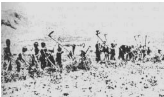
Adullamští chlapci jsou naprosto obyčejní chlapci. Zde pracují na zahradě.