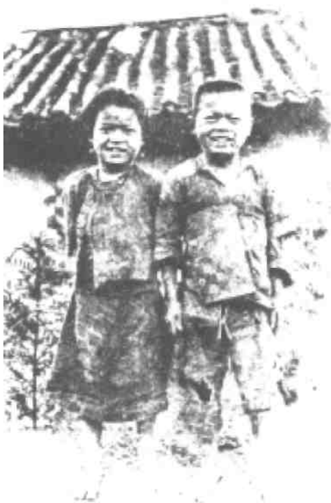
Dva mladí věřící