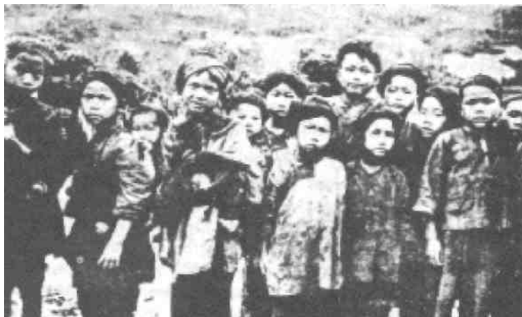
Domorodé děti v Číně

V tomto zkaženém věku, uprostřed této nevěřící převrácené generace, Pán stále může a bude dokazovat, že to, co On napsal v Bibli, je slovo živého Boha. On se pohybuje a může se pohybovat ve středu věřících lidí nadpřirozeným způsobem skrze dary Ducha svatého, potvrzujíc slovo znamení (Marek 16:15-20).