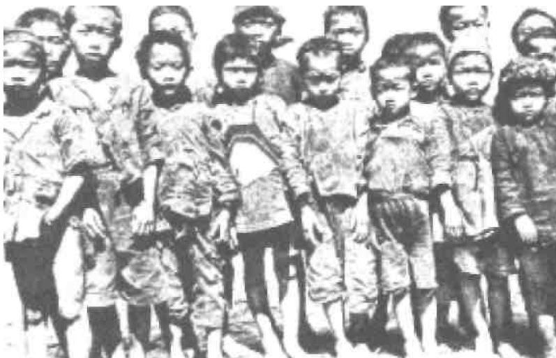
Chlapci žebráci, kteří našli svůj domov v sirotčinci Adullam

Jako naplnění Písma, které praví, že „v posledních dnech... vaši synové ...budou prorokovat“ (Skutky 2:17), jeden desetiletý chlapec, který býval žebrákem v Číně, byl použit jako mluvčí pro Pána, aby nám přinesl poselství skrze přímou inspiraci.