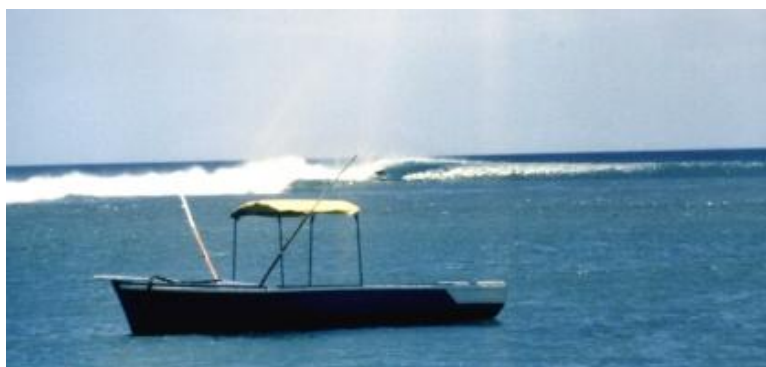
Val de surfing în Mauritius

La esca pe care am făcut-o în Reunion am găsit un uluitor val de surfing numit St. Leu, unde m-am distrat grozav. Apoi m-am îndreptat spre Mauritius. Era în martie 1982 și călătoream de aproape doi ani, de multe ori dormind într-un cort și pe diverse plaje și trăind ca un nomad. Era timpul să mă întorc acasă.