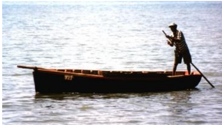
Barcă de lemn în Mauritius

Cei doi prieteni ai mei au ridicat barca și au trecut-o peste recif, cu mine înăuntru. Fundul bărcii se freca de recif. Barca era din lemn și cu ea își câștigau traiul, așa încât am știut că situația era foarte gravă dacă făceau asta. Au ridicat-o, apoi au lăsat-o în lagună și au înotat, încercând să-i facă vânt ca să pornească. Le-am spus să vină cu mine, dar mi-au răspuns: „Nu, este prea grea, ia-l pe băiat să te ducă la țărm.” Așa că copilul acesta a împins barca spre țărm cu o prăjină.