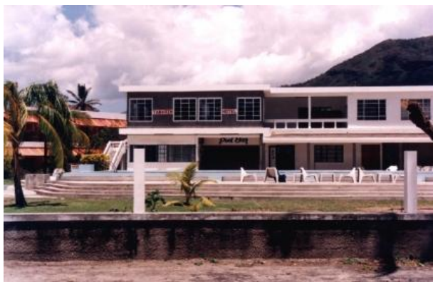
Hotelul din Golful Tamarin