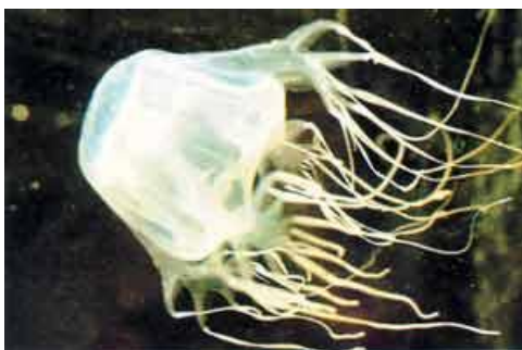
Viespe de mare

Ne-am scufundat. Eu am luat-o în susul recifului, iar cei doi prieteni ai mei au luat-o în jos. De obicei stăteam împreună, dar dintr-un motiv oarecare ne-am despărțit. Căutam languste, când fasciculul lanternei mele a dat de o creatură marină stranie în apa întunecată. Semăna cu un calmar. Curios, am înotat mai aproape de ea și efectiv am întins mâna s-o prind. Aveam mânușile de scafandru și pur și simplu mi s-a strecurat printre degete ca o meduză. O priveam în timp ce se îndepărta, intrigat, deoarece era o meduză cu aspect foarte ciudat. Avea ceea ce părea a fi capul în formă de clopot al unui calmar, dar spatele avea formă de cutie și tentaculele erau foarte neobișnuite, transparente, ca niște degete, care se întindeau mult în urma ei. Până atunci nu mai văzusem acel soi de meduză, dar m-am întors și am continuat să caut languste.