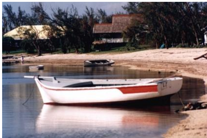
Riviere Noire, locul unde a acostat barca și a fost lăsat lan

Era cam miezul nopții. Locul era pustiu – nici o mașină, nimic. Mă țineam de băiat, întrebându-mă cum păcatele aveam să ajung de acolo la spital atât de târziu în noapte. Piciorul drept era așa de slăbit încât m-am așezat pe asfalt. Băiatul a încercat să mă ajute, dar în cele din urmă a început să arate din nou spre ocean, zicând: „Frații mei! Trebuie să mă duc după ei”. I-am zis să rămână și să mă ajute. Știam că ceilalți puteau înota în siguranță de la recif pentru că meduzele se aflau de cealaltă parte a recifului. Dar a plecat și am rămas singur pe marginea șoselei, în toiu nopții. Nu mai aveam nici o speranță și m-am lungit ca să mă odihnesc.