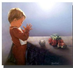
Child's Prayer Copyright 2002 by Danny Matthews. All rights reserved by the artist.

"Învată pe copil calea pe care trebuie s'o urmeze, și când va îmbătrâni, nu se va abate de la ea."