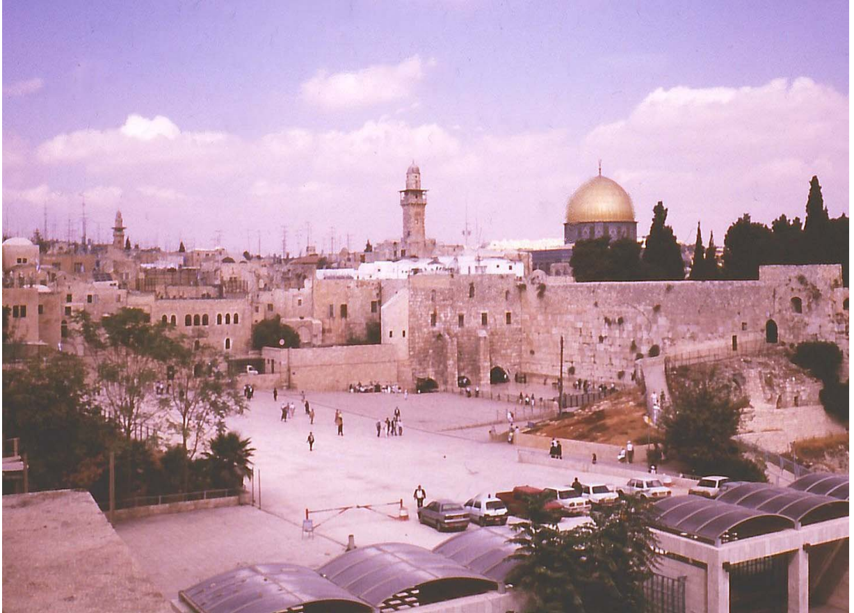
84. ཡེ་རུ་ག་ལེམ།