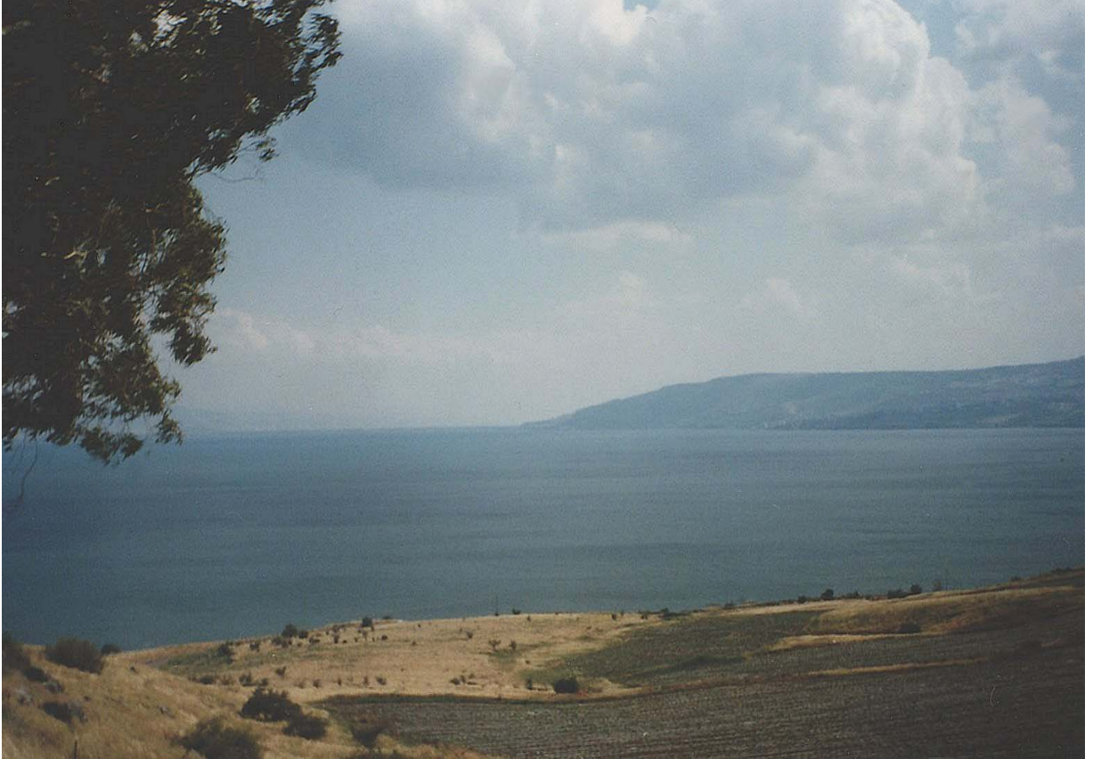
87. ག་ལིལ་མཚོ།