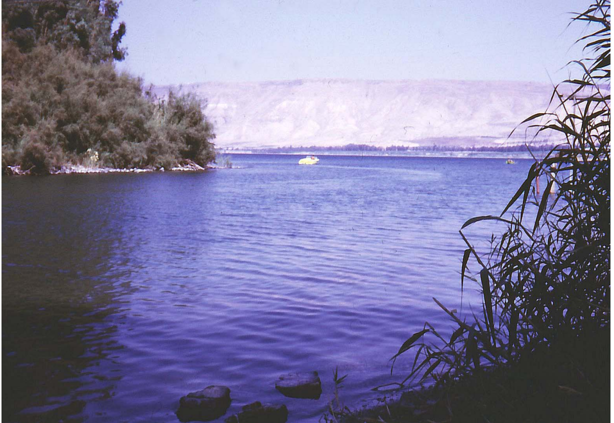
85. ཡོར་དན་གཙང་པོ་དང་ག་ལིལ་མཚོ།