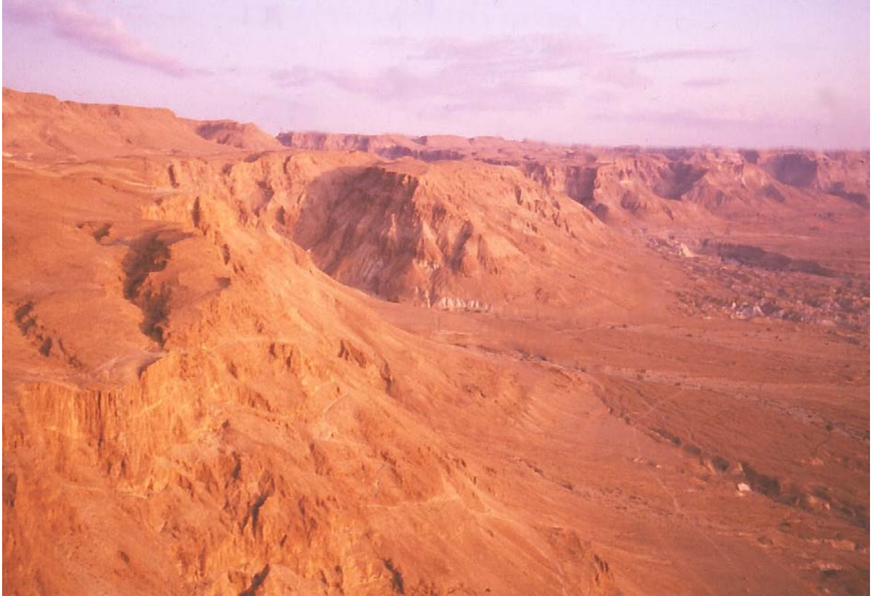
86. ཡི་སི་ར་ཨེལ་གྱི་ཡུལ་ལྗོངས།