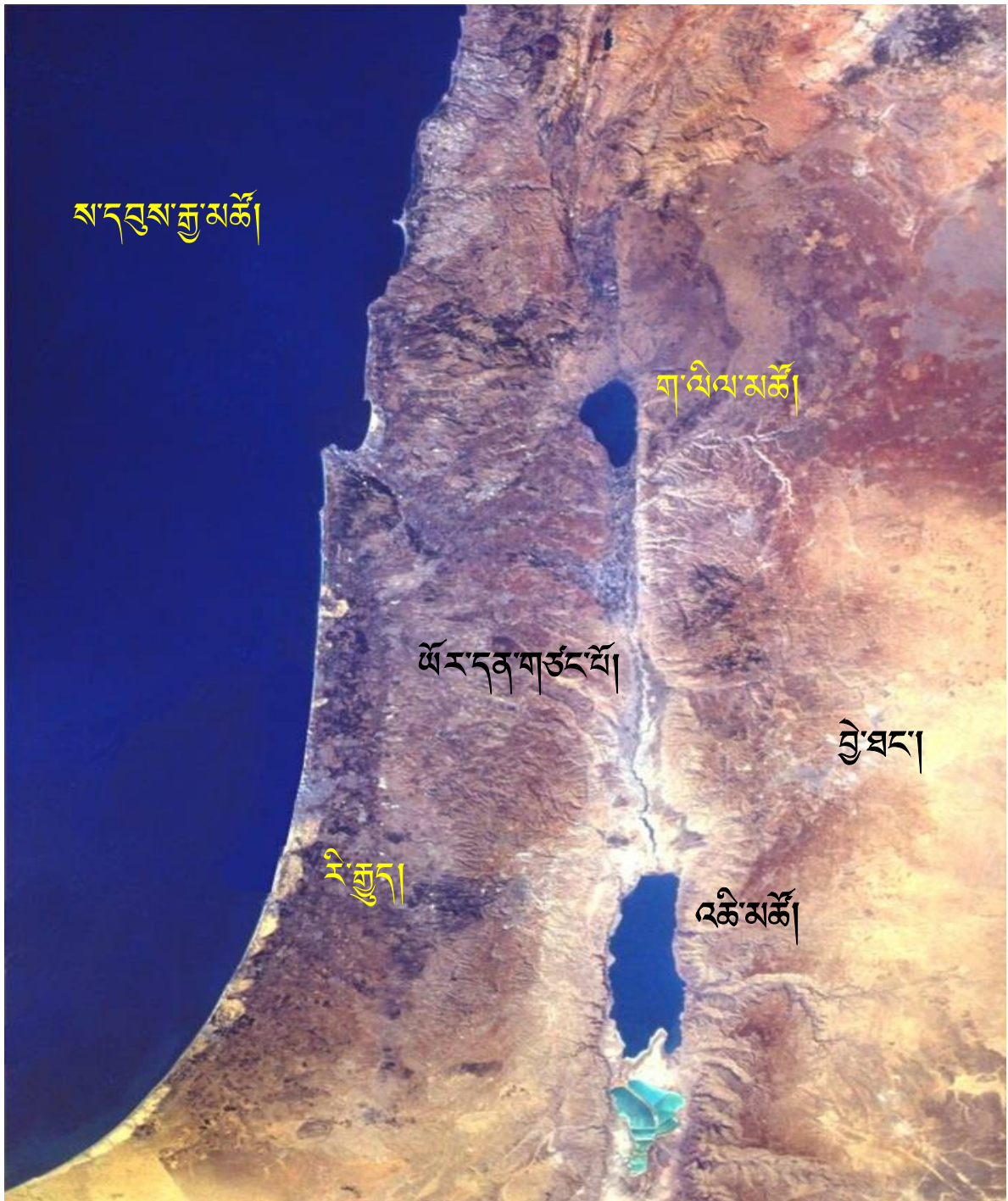
75. ཡི་སི་ར་ཨེལ་ཡུལ་ཨང་2