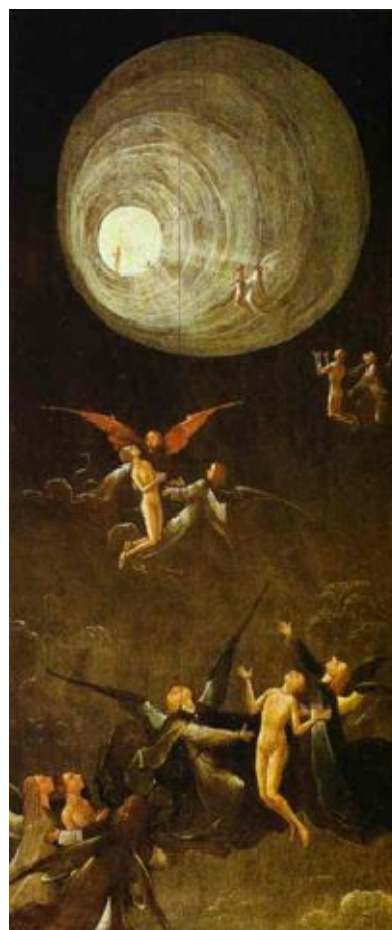
VZESTUP SVATÝCH 1490 Hieronimus Bosch

„Halucinace mají sklon k nepořádku, jsou to velice neuspořádané zkušenosti a nemají nic společného s vysoce uspořádanými a strukturovanými zkušenostmi lidí z klinické smrti. Vždy se těchto lidí ptám: „Byla tato zkušenost podobná snu?“ Odpovědi zní jednoznačně: „Ne, nemá to se snem nic společného.“ Sny nemají takový řád a strukturu, jako tyto zkušenosti. Někteří mají zastrašující hrůzostrašné zkušenosti, ale i zde vidíme logické zakončení a lidé poté začínají zkoumat svůj život, kde dělali v životě chybu.“