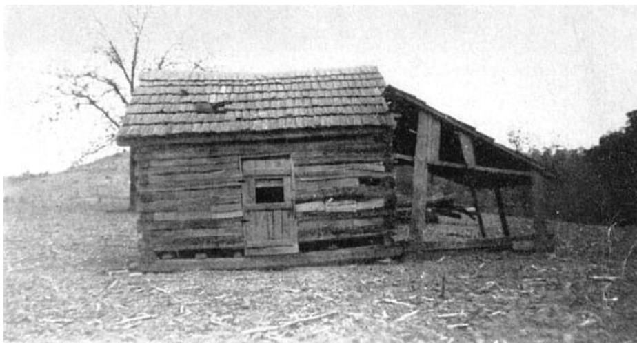
Dřevěný srub nedaleko městečka Burkesville, Kentucky, kde se 6. Dubna 1909 narodil kazatel William Branham