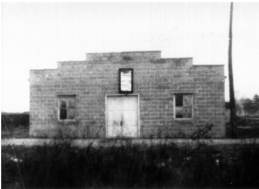
Modlitebna na rohu ulic Osmé a Penn v Jeffersonville