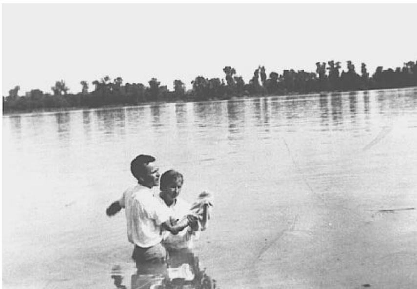
Křest v řece Ohio v roce 1933

Zatímco se první pokřtěná osoba brodila směrem ke břehu, další kandidát se brodil vodou a Billy povzbudil dav: "Proč nám Ježíš nařídil, abychom křtili? Inu, pouze kvůli jedné věci, je to symbolická smrt; smrt tomuto světu - ten starý člověk jde do hrobu, aby mohl vyjít a žít novým životem v Ježíši Kristu. Ale zapamatujte si, křest vás nezmění; je to pouze vnější znak vnitřního díla. Věřící tímto vydává svědectví před světem, že Ježíš Kristus už změnil jeho nitro."