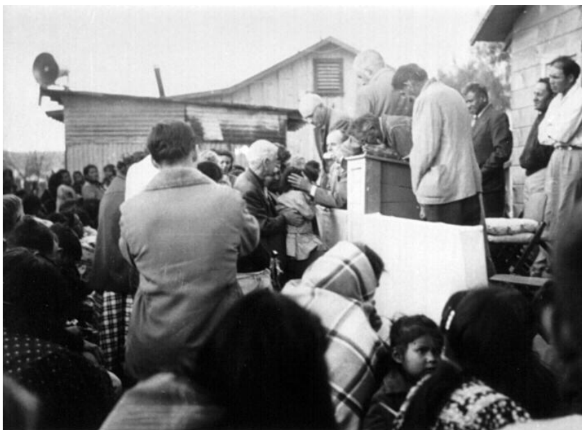
V San Carloské rezervaci Apačů

Protože maminka neuměla mluvit anglicky, apačská tlumočnice se jí musela zeptat, na co vlastně stoná její dcera. Pak tlumočnice vysvětlila: “Ona je hluchá ... nemá. Před mnoha lety jí to způsobila horečka.”