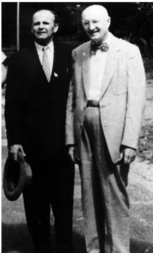
W. M. Branham s F. F. Bosworthem

Hned prvního večera prošlo modlitební řadou v Miami asi sto lidí. Víra narůstala, když publikum bylo svědkem, jak Bill zjevoval nemoci darem ve své ruce. Většina případů byla uzdravena a staly se některé významné zázraky, včetně dvou slepě narozených chlapců, kteří oba obdrželi zrak. Zprávy o těchto zázracích přinesly ranní noviny. To vzbudilo zájem místní rozhlasové stanice a oba chlapci byli pozváni do studia k rozhovoru. Bez rozpaků a s horlivostí tyto dvě děti vydaly svědectví o uzdravující moci Ježíše Krista. To povzbudilo zájem veřejnosti - u některých ze zvědavosti, jiných se vzrušením a ještě jiných se skepticismem.