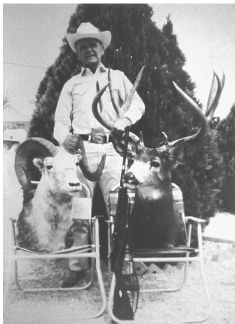
Paroží Coloradského jelena