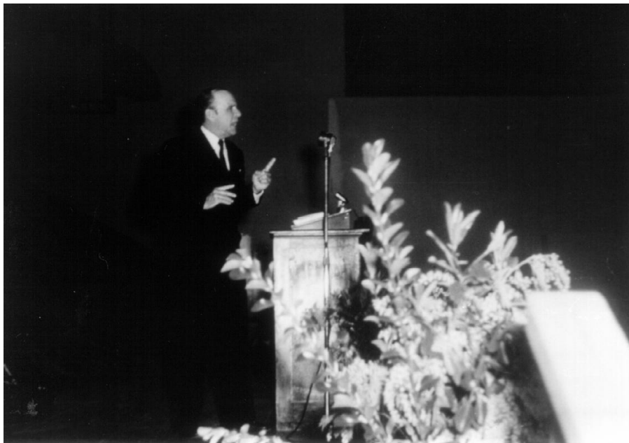
Fotografie 1 – Lakeport, Kalifornie

Ke konci jeho kázání udělal nějaký fotograf z jeho pravé strany několik snímků. Když vyvolal svůj barevný film, první snímek vypadal úplně normálně a ukazoval pravou stranu Williama Branhama stojícího na pódiu a gestikulujícího při kázání. Proutěný koš plný lilií byl postaven z pravé strany pódia jako dekorace hned vedle jednoduchého mikrofonu přidělaného k stojanu, stojícímu na zemi. Za ním na stropě visela hranatá krabice elektrického ohříváče. Dva muži seděli ve skládacích židlích v zadní části pódia. Za těmito muži visela záclona, která jakoby vycházela z jednoho bodu nahoře a dole se vějířovitě rozšiřovala, buď jako dekorace nebo měla zakrývat nějakou věc, která nemohla být odstraněna.