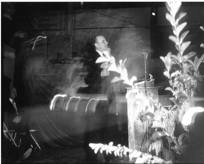
Fotografie 2 — Lakeport, Kalifornie

Na další fotografii vypadalo pódium jako nějaký neobyčejný obraz, se salajícími ohnivými jazyky a skvrnami sjantarově zbarvenými mlhavými záplatami. Anděl Páně stál po Billově pravé straně a vypadal jako oblak asi dva metry vysoký. Stál mezi evangelistou a lidmi, kteří se formovali do modlitební řady po levé straně budovy. (Bill vždy přiměl lidi v modlitebních řadách, aby přistupovali z jeho pravé strany tak, aby se zastavili a stáli v přítomnosti anděla.) Na této fotografii nebyl anděl jedinou podivuhodnou věcí, která byla viditelná. Bezprostředně za Billem se nacházel Ježíšův profil (tvář, brada, krk) s prodlouženými rameny a ohnivými jazyky šlehajícími z jeho rukou — sedm zřetelných ohnivých pruhů, které se jako pochodující poslové řinuli kupředu k muži, který zrovna káže. Billovo tělo jako kdyby bylo tímto žářem nadpřirozeného ohně pohlceno. (Když se Bill později na tuto fotografii podíval, řekl, že mu to připomíná scénu z proroků popsanou u Ezechiele 1 a ve Zjevení 4:5.) v takové atmosféře nebyla o zázraky nouze, a byla to toho večera obzvlášť šťastná chvíle pro slepou ženu, jež tady v Lakeportu byla někým přivedena do modlitební řady. Byla americkou Indiánkou. Její oči vypadaly, jakoby byly celé bílé. Nelze ani říct, že duhovka a oční panenky byly pokryty bělmem — duhovky