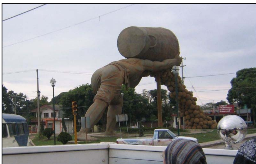
Socha muže, který vysypává sběr pomerančů z koše – Městečko někde v Mexiku

Jeden z našich pastorů, kterého jsem přivedl k Pánu, kázal evangelium v jedné vesnici, kde nikdy předtím neslyšeli jméno Ježíš. Je to můj dobrý přítel a strašně rád si jen tak sednu a poslouchám ho, jak káže evangelium. Opravdu velmi dobře káže, je o hodně starší než já. Nemají tam elektřinu, jen občas uvidíte, že ji někdo má. Nemají tam vodovod, žádné vymoženosti, které máte vy. Takže byli v této vesnici, měli s sebou nějaké traktáty a kázali o Ježíši. Když přišli k jednomu domu, tak vyšel muž a zeptal se jich, co chtějí. „Chceme vám jen říct o Ježíši.“ Ten muž neřekl ani slovo, ale vrátil se s dlouhou mačetou v ruce. „Už jsem na vás na všechny čekal.“ Snažil se je zabít, tak se všichni rozutekli. Tito kazatelé vědí jak utíkat – zvláště v pralese. Když už nějakou dobu honil tohoto pastora po lese, tak se k němu pastor otočil a řekl mu: „Co je s tebou?“ „Já tě zabiji!“ „Já jsem ti ale nic neudělal.“ „Ale ano, udělal!“ „A co jsem ti tedy udělal?“ „Tvá vina spočívá v tom, co jsi neudělal.“ Chápete to? Z toho, co neděláte, právě z toho budou křesťané souzeni. Můžeme citovat krásné verše a zpívat nádherné písně, ale když opustíte ty dveře církve... tak jen hrstka lidí je schopna konat Boží vůli. Něco není v pořádku. To je špatně připravená armáda. Takže on vzal tohoto pastora