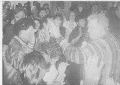
Dineh Christian Center in Shiprock, New Mexico