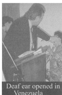
Hluché uši se otevírají ve Venezuele