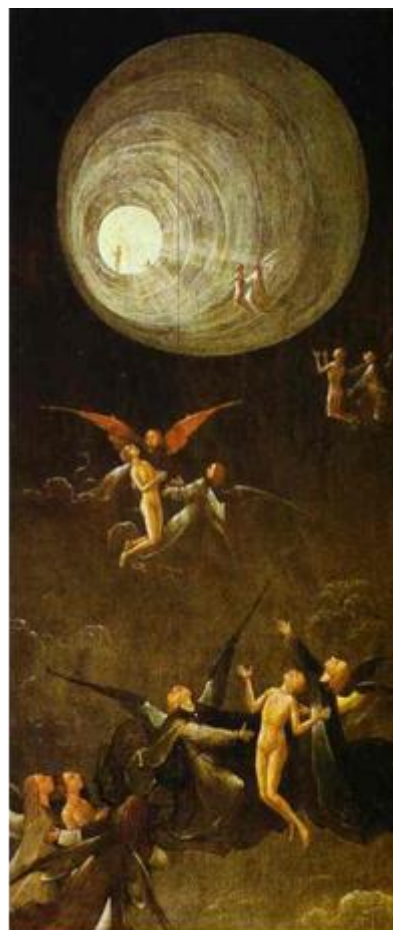
VZESTUP SVATÝCH 1490 Hieronimus Bosch

„Halucinace mají sklon k nepořádku, jsou to velice neuspořádané zkušenosti a nemají nic společného s vysoce uspořádanými a strukturovanými zkušenostmi lidí z klinické smrti. Vždy se těchto lidí ptám: „Byla tato zkušenost podobná snu?“ Odpovědi zní jednoznačně: „Ne, nemá to se snem nic společného.“ Sny nemají takový řád a strukturu, jako tyto zkušenosti. Někteří mají zastrašující hrůzostrašné zkušenosti, ale i zde vidíme logické zakončení a lidé poté začínají zkoumat svůj život, kde dělali v životě chybu.“