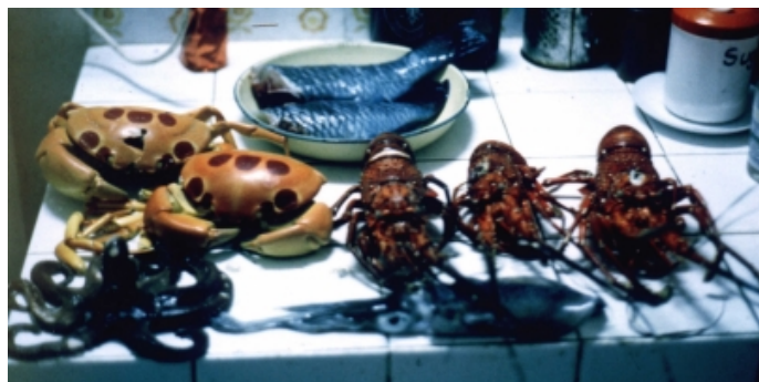
Une récolte typique de fruits de mer

Après avoir surfé tout mon soûl sur le récif gaucher très rapide de Tamarin, il me restait très peu d'argent. Alors j'ai pris la direction de l'Afrique du Sud où j'ai trouvé un emploi en enseignant la planche à voile et le ski nautique. C'est étonnant qu'ils m'aient payé à faire ceci ! J'ai surfé Jeffreys Bay et Elands Bay et j'ai visité certaines réserves naturelles parmi les plus célèbres du monde.