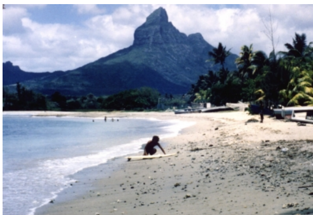
La Baie de Tamarin

Pendant mon séjour sur cette île j'ai fini par vivre à la Baie de Tamarin (« Tamarin Bay ») parmi les pêcheurs et des surfeurs créoles indigènes. Ils m'ont accepté dans leurs vies et m'ont appris comment faire la plongée la nuit à partir des récifs extérieurs.