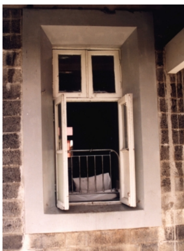
La fenêtre de l'hôpital