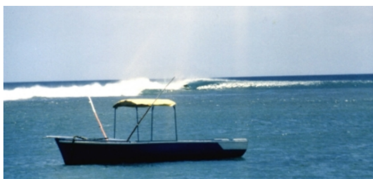
Surfbreak' près de l'île Maurice

Pendant mon étape sur l'île de la Réunion, j'ai trouvé un « surf break » stupéfiant appelé « St Leu » où j'avais quelques vagues magnifiques juste pour moi. C'était au mois de mars, en 1982. En ce moment là, cela faisait presque deux ans que je voyageais ainsi, souvent dormant à même dans une tente à la plage et vivant comme un nomade.