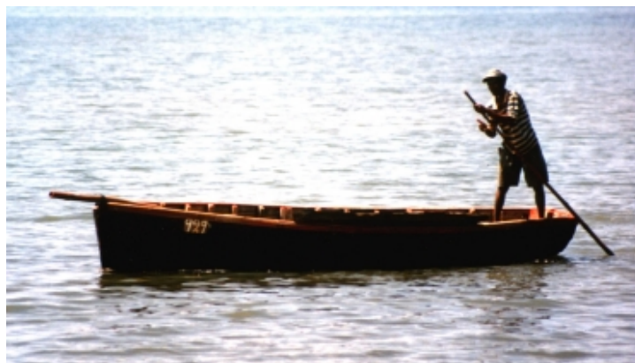
Bateau en bois de l'île Maurice

Je sentais le poison passer dans mon courant sanguin et donner un coup à quelque chose sous mon bras. Il avait frappé un ganglion lymphatique. Cela devenait de plus en plus difficile pour moi de respirer dans le poumon droit. Celui-ci était comprimé par ma combinaison, alors j'ai défait la combinaison avec mon bras gauche, puis je l'ai enlevée et j'ai mis ma culotte pendant que je pouvais toujours bouger. J'avais la bouche sèche et j'y étais assis, trempé par la transpiration.