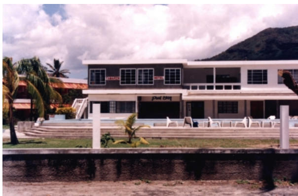
L'hôtel de la Baie de Tamarin